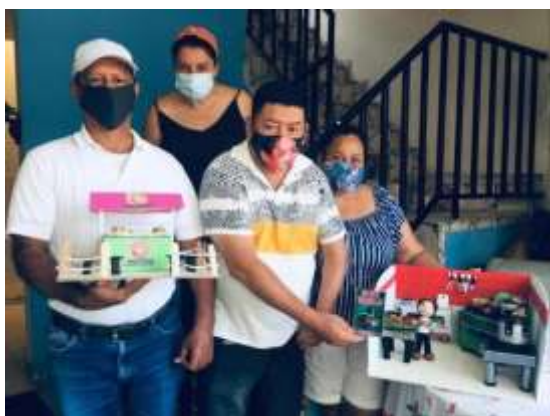
Municipio de Melgar