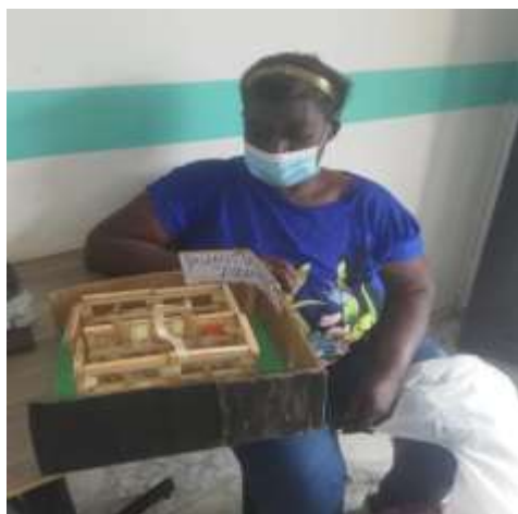
Municipio de Rioblanco