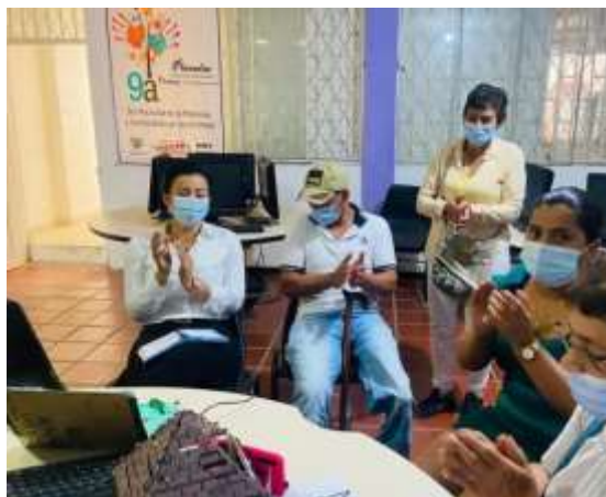
Municipio de Planadas